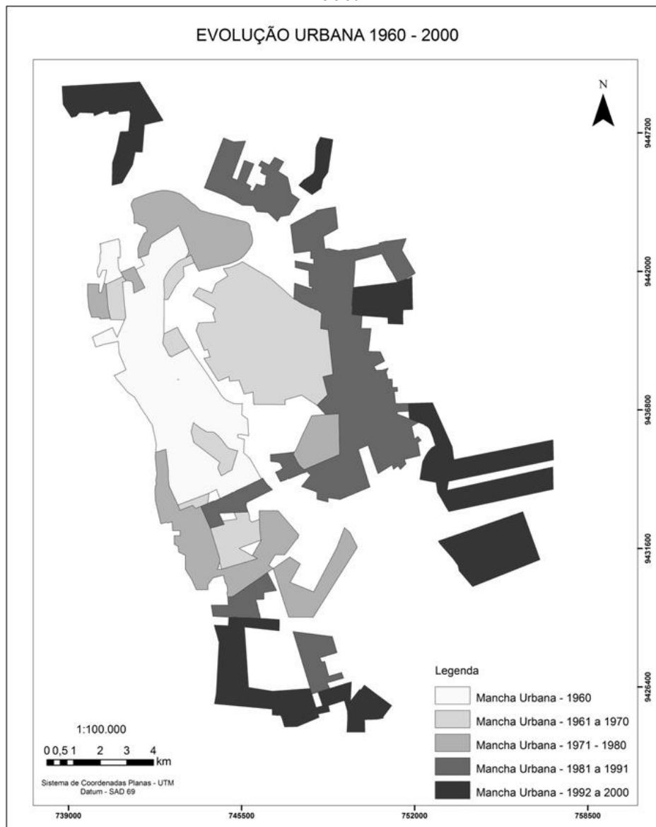
FIGURA 3 - MAPA DA EVOLUÇÃO DA MANCHA URBANA EM TERESINA 1960 - 2000.

Apresentamos agora a figura 3 com o mapa da evolução da mancha urbana de Teresina entre 1960 até os anos 2000, que ajuda a demonstrar a evolução espacial da ação desses agentes que produziram a cidade no período analisado, refletindo a atuação desigual, de alguns desses agentes, em cada área da cidade, concentrando certas zonas em determinados períodos em determinadas áreas.